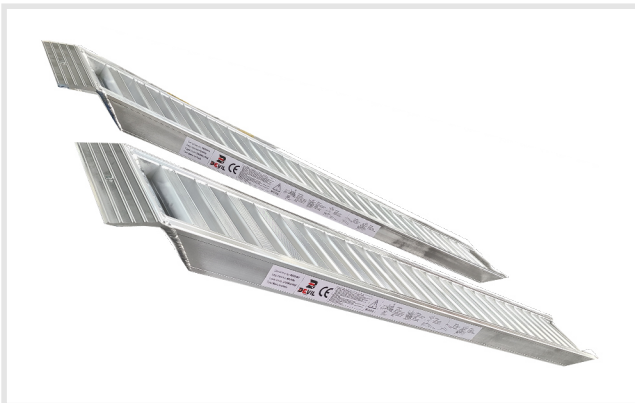
Barra fechada (2)